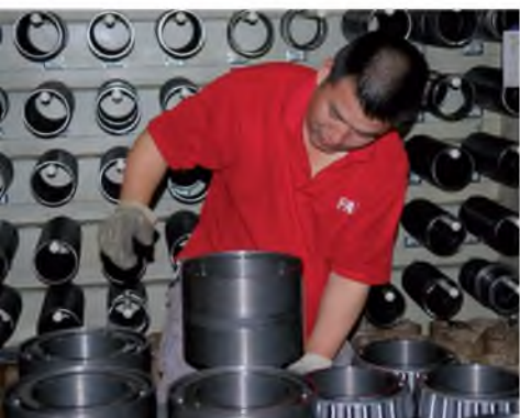
TAROL 轴承装配—轴向游息