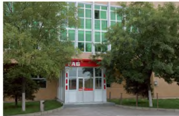
富安捷铁路轴承（宁夏）有限公司

此外，公司还承接轴箱轴承的大修业务，工厂专门建造了独立的大修轴承作业车间，任何厂商生产的产品均有能力在此大修。现公司最大的维修业务客户是中国铁道部。