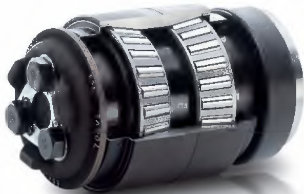
依照 AAR（美国铁路联盟）标准的英制尺寸 TAROL 轴承单元