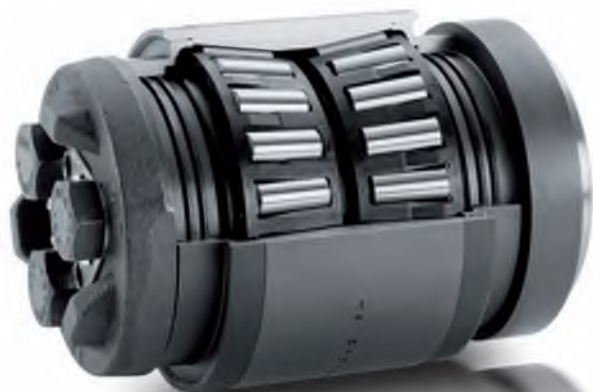
公制尺寸 TAROL 轴承单元